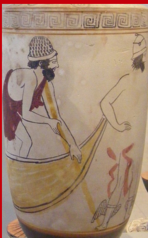
Charon, tel qu'on se le représentait au V e s. av. J.-C. ( Lécythe funéraire, Metropolitan Museum )

L'intraitable nocher apparaît également sur des représentations plus récentes.