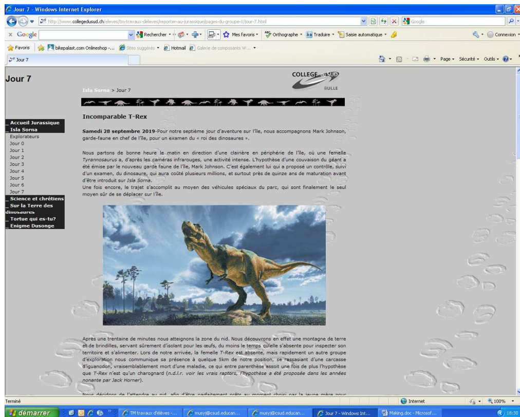
Figure 2 : Voici une deuxième capture d'écran du site. Elle illustre l'organisation en « jours » du site. Elle offre également un aperçu du design et de la mise en page.